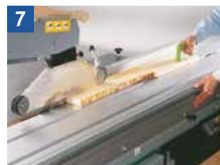
7 Sägen von Leisten mit Schiebeholz