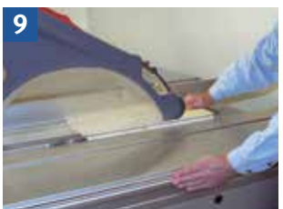
9 Schutzvorrichtung und Handhaltung beim Fälsen