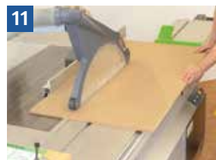
11 Schutzvorrichtungen und Handhaltung beim Einsetzen des Sägeblatts. Sägeblatt wird von unten nach oben durch das Werkstück angehoben.