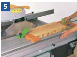
5 Vorrichtung und Handhaltung beim Besäumen