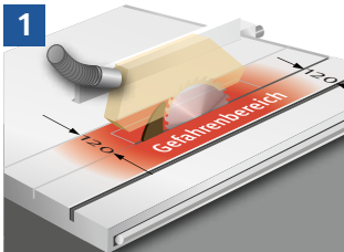
1 Eingreifen in den Gefahrenbereich nur mit Hilfsmittel