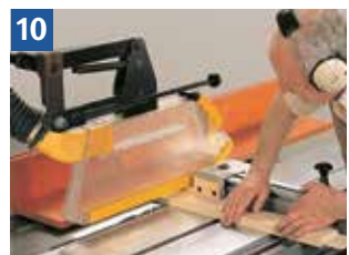
10 Schutzvorrichtung und Handhaltung beim Absetzen von Zapfen