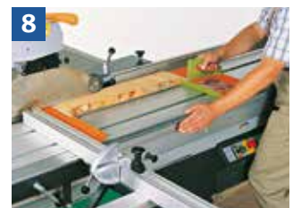
8 Sägen von Leisten mit vorderer und hinterer Sägehilfe