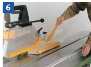
6 Sägen schmaler Werkstücke mit Schiebstock