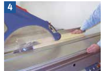
4 Längssägen von Breite mit der Hand (Breite über 120 mm)